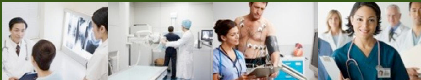
Pacific Cancer Centre

Врачи во всем мире сходятся во мнении, что раннее выявление болезни – наиболее сильное оружие в борьбе с раком. Сегодня реально не только выявить рак на самых ранних стадиях, но и просчитать риск его появления в будущем. Программа элитной онкодиагностики предназначена прежде всего для предупреждения болезни, а в случае ее обнаружения, незамедлительного лечения лучшим специалистом в комфортных условиях.