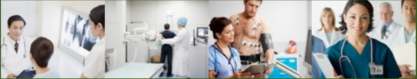
Pacific Cancer Centre

Врачи во всем мире сходятся во мнении, что раннее выявление болезни – наиболее сильное оружие в борьбе с раком. Сегодня реально не только выявить рак на самых ранних стадиях, но и просчитать риск его появления в будущем. Программа элитной онкодиагностики женщин предназначена прежде всего для предупреждения болезни, а в случае ее обнаружения, незамедлительного лечения лучшим специалистом в комфортных условиях.