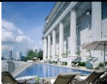
SOMERSET SERVICED APARTMENTS